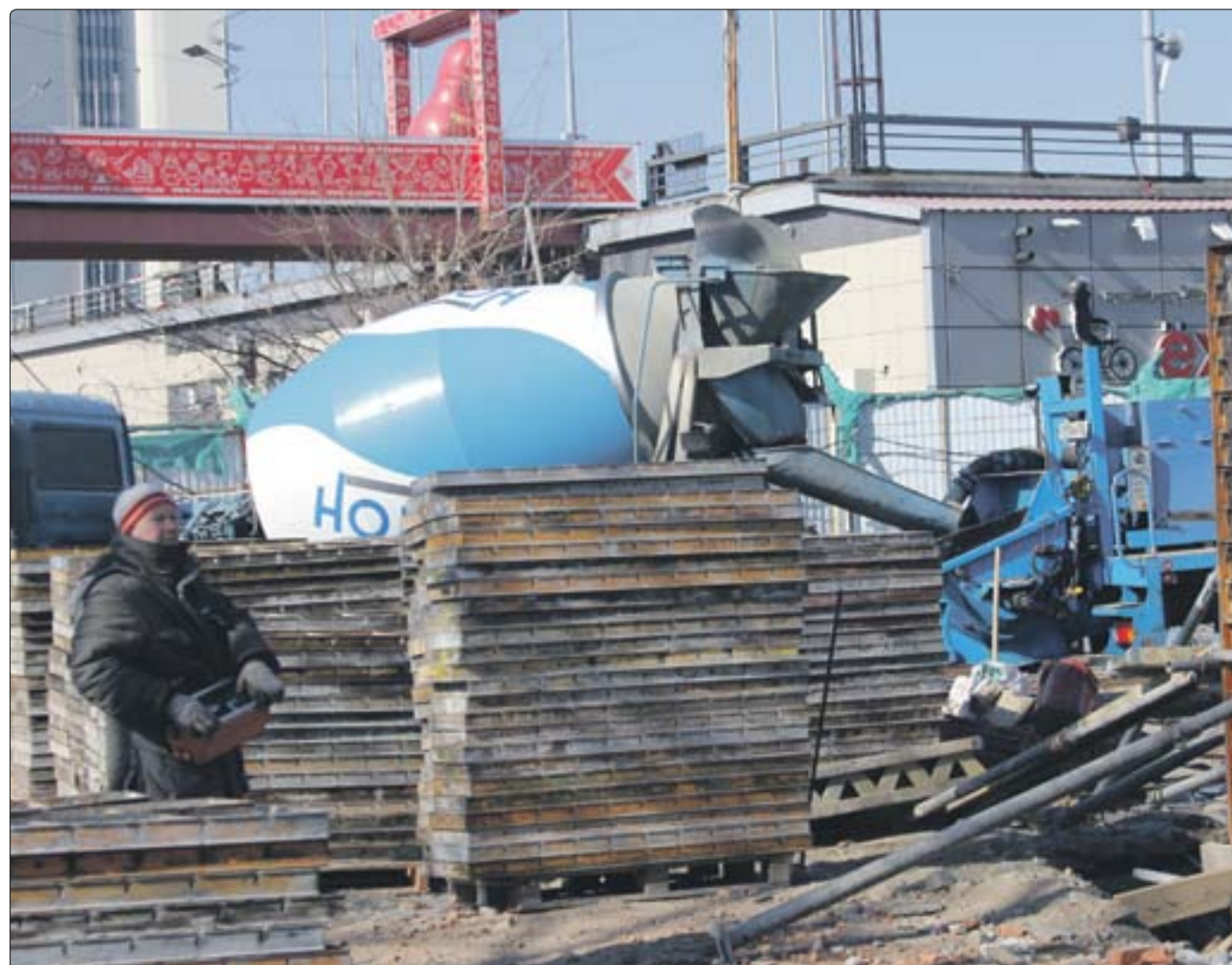
■ Поддача раствора регулировалась автоматически с пульта