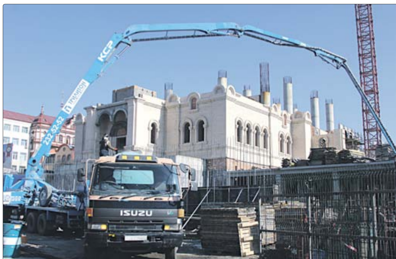
■ Заливка раствором стилобатной части. Целый день на стройку шли машины с бетоном.

Адрес: 690091 г. Владивосток, ул. Пологая, д. 65, тел.: (423) 240-22-03.