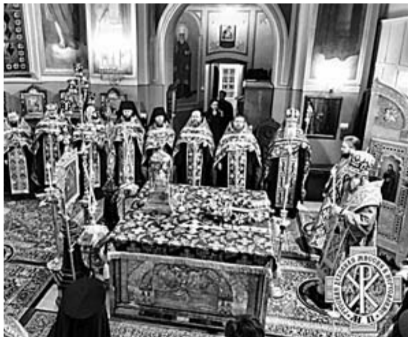
■ Епископ Иннокентий возглавил Всенощное бдение в Троицком храме Русской Духовной миссии