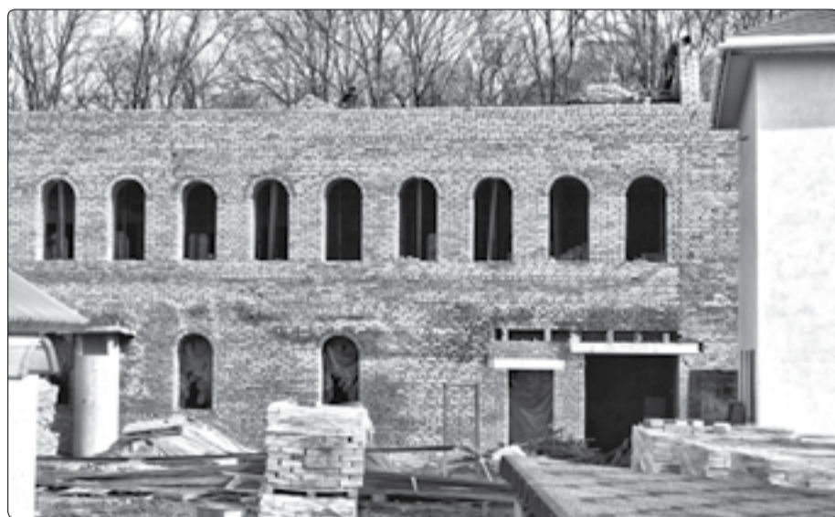
■ Возводится здание церковно-причтового дома в Покровском приходе