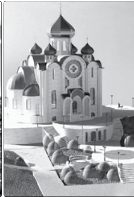
■ Эскиз Андреевского храма на б. Тихой