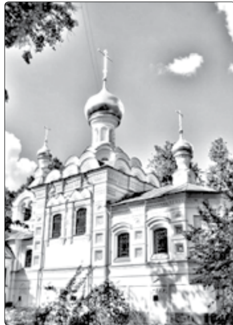
■ Проектный вид храма св. вмч. и целителя Пантелеимона.