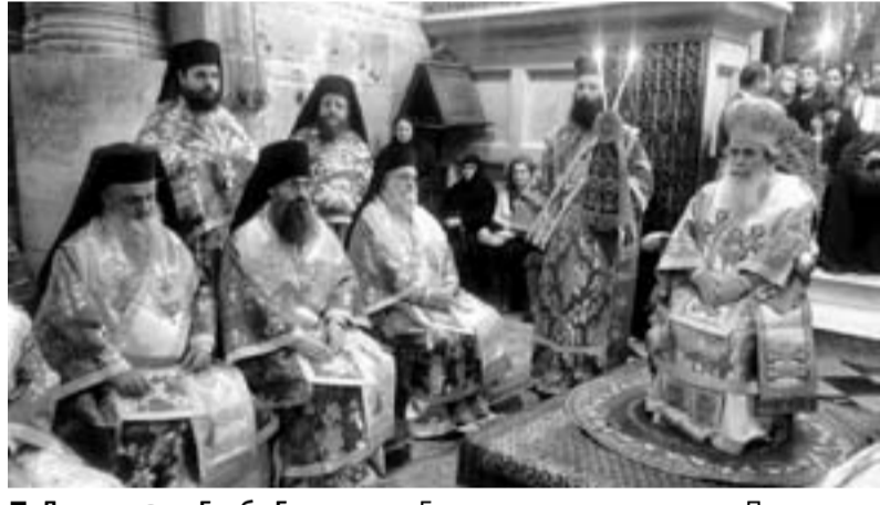
■ Литургия на Гробе Господнем. Богослужение возглавляет Патриарх Святого Града Иерусалима и всея Палестины Феофил

— Напомню слова одного из первых русских паломников, игумена Даниила (XII век). Он поучал: если кто, услышав о местах святых, потянется душой и мыслью к ним, то одинаковую благодатную награду примет от Бога с теми, кому удастся дойти до Святой Земли. Многие добрые люди своей милостью в убогим, добрыми своими делами достигают святых мест и большую пользу примут от Бога Спаса нашего Иисуса Христа. Спаси всех Господь!