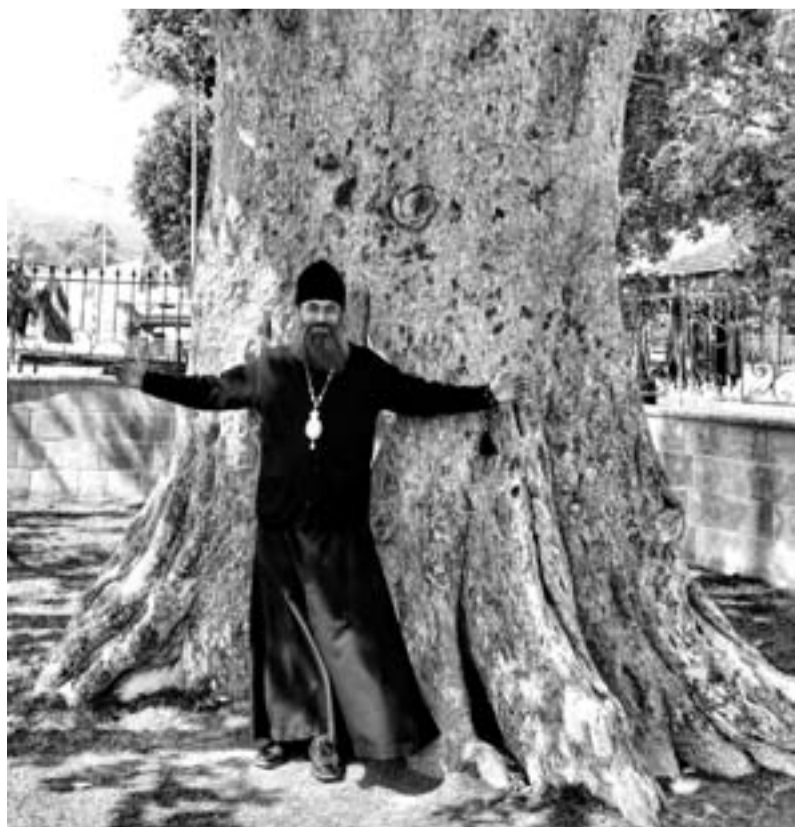
■ У дерева Закхей в Иерихоне