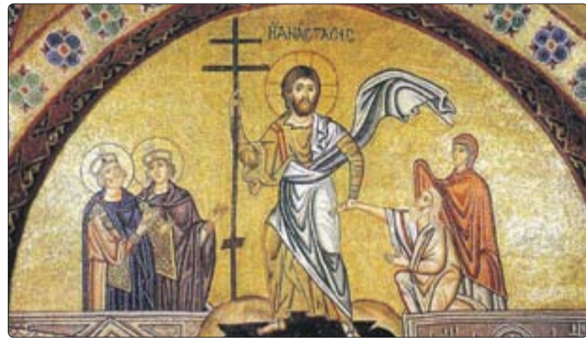
Иконография Воскресения Христова

— Тем, для кого церковь еще не является домом, хотелось бы пожелать, чтобы они сами ощутили и увидели, как прекрасна, добра, удивительно светла жизнь в Христовой Церкви, сколько в ней предуготовано будущего для каждого человека.