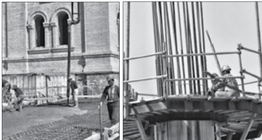
■ На строительной площадке Преображенского кафедрального собора