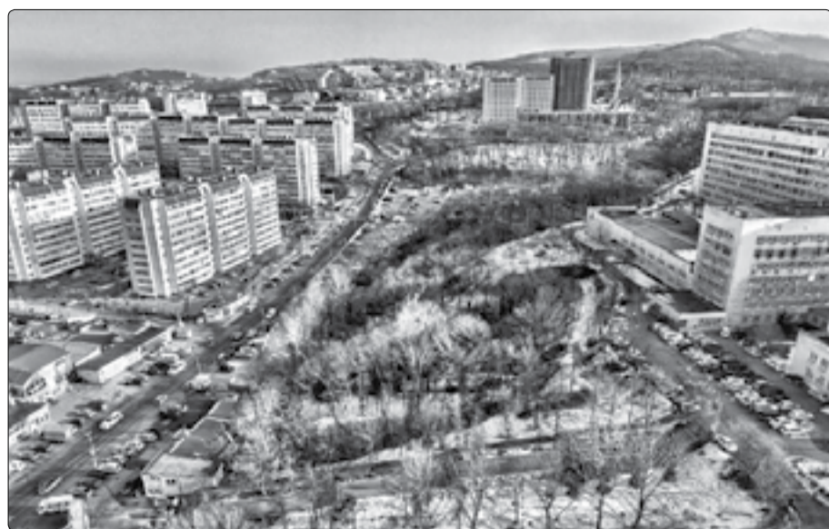
■ Район ВКБ № 2, где планируется разместить больничный храм

КПП 254001001, ОГРН 1022500002579 ОКПО 20786238 Учетный номер 2511010104